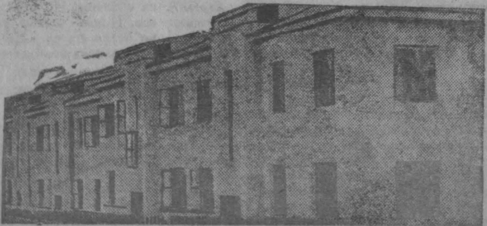
80 т. кв. метр. жилая площадь выстроено в гор. Ленинске

В 1931 году государственные доходы составляли 380 тысяч рублей, в 1934 году государственные доходы равны 10317 тысяч — 2715 проц.