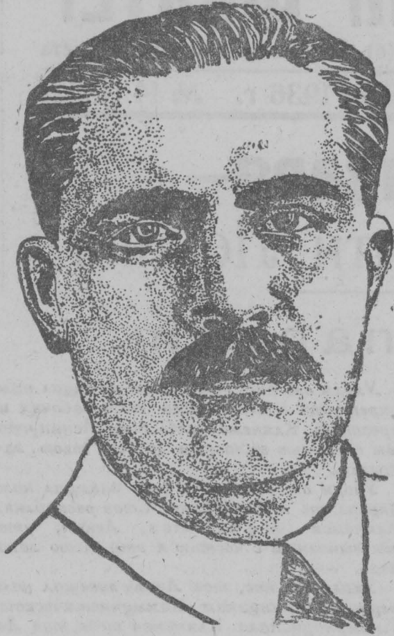
Совещание 18 января