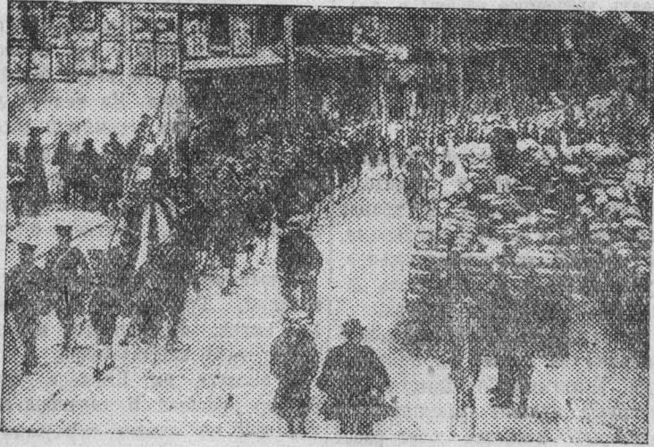
НА СНИМКЕ: Японские мряки покидают территорию иностранной концессии в Шанхае и направляются в квартал Чапей.