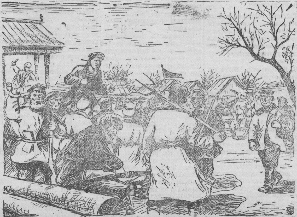
Матросы и солдаты во главе крестьянских выступлений (сентябрь 1917 г.). С картины худ. П. Васьилева из 1-го тома «История гражданской войны в СССР».