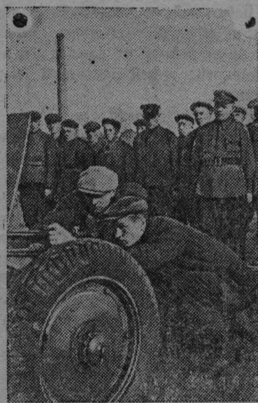
ГЕРОИЧЕСКИЕ ЗАЩИТНИКИ ЛЕНИНГРАДА.

Никакие временные успехи врага не сломают волю советских людей. Чем серьезнее положение, тем сильнее сплотимся мы для борьбы, для изгнания немецко-фашистских захватчиков с нашей родной советской земли.