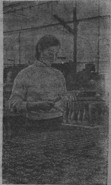
На Н-ском заводе.