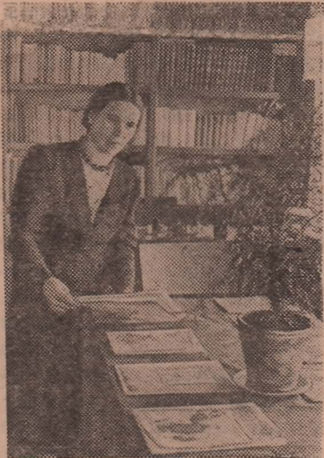
В библиотеке-читальне колхоза имени Тамираева Рыбинского района Ярославской области.