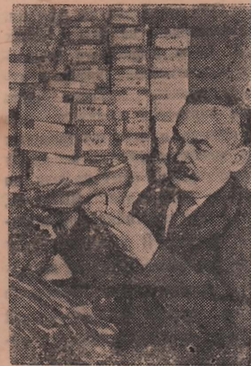
Московская ордена Ленина обувная фабрика «Буревестник» возобновила выпуск дамской модельной обуви из цветного шевро.

Другая группа экскурсантов отправилась из Туапсе в путешествие по берегу Черного моря. Они посетят Сочи, Мацесту, Адлер. Большая группа туристов из Таганрога, Новороссийска и других городов пройдет по местам недавних боев — вдоль бывшей линии Миус-фронта, побывает на Таманском полуострове. (ТАСС).