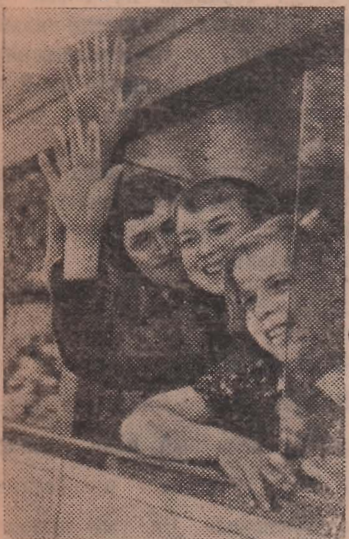
На летний отдых выехали 400 детей работников Метростроя. НА СНИМКЕ: дети перед отъездом.