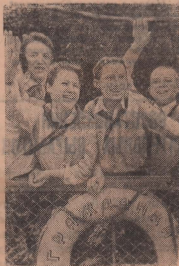
18 июля из Химкинского порта (Москва) вышли теплоходы «Герцен», «Гражданка» и «Рабочий». Около 700 пионеров — начальники штабов дружин, вожатые отрядов и звеньев, редакторы стенных газет и лучшие кружковцы городского Дома пионеров — отправившись в путешествие по Волге на 40 дней.

БУХАРЕСТ, 4 сентября. (ТАСС). Все газеты поместили на видном месте полный текст обращения тов. И. В. Сталина к народу. Газеты поместили портрет тов. И. В. Сталина. Все газеты поместили также приказ Генералиссимуса И. В. Сталина по случаю победы над Японией.