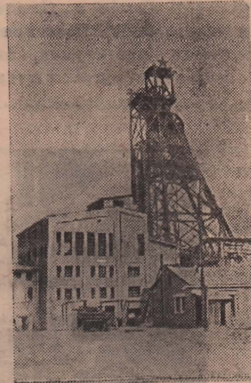
Восстановленная шахта имени ОГПУ треста „Н. Светай антрацит“ комбината „Ростов уголь“. Ее суточная добыча — семь тысяч тонн угля.

Украинский государственный институт проектирования городов разработал генеральную схему районной перестройки Донецкого бассейна. Предполагается, что многие населенные пункты, близко расположенные друг к другу (Снежное, Буденовка, Первомайск и другие), сольются в большие города, что облегчат их благоустройство. Намечаются также меры к бводнению и озеленению Донбасса. Будет сооружено несколько новых водохранилищ бассейнов рощи. На реке Донец и на побережье Азовского моря проектируются новые здравницы для шахтеров и металлургов. Основные железнодорожные магистрали будут электрифицированы. Прокладываются новые автодороги, которые соединят между собой все промышленные центры Донбасса.