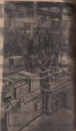
В Москве открылась выставка подготовленных предприятиями народного вооружения СССР. На ней представлено свыше 400 экспонатов, в том числе 243 станка, электрооборудование и различные инструменты. На снимке: агрегатно-расточный станок для заводов сельскохозяйственного машиностроения, обрабатывающий одновременно отверстий. Станок изготовлен Люберецким заводом сельскохозяйственного машиностроения им. Ухтомского.