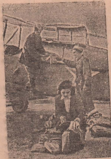
Ежедневно самолеты Ростского-Дону аэропорта доставляют свежие газеты, журналы и письма в газетные пункты области. На снимке: погрузка почты в самолет.

СТАЛИНО. На Горловском машиностроительном заводе им. Кирова закончена сборка тысячной врубовой машины, выпущенной заводом после освобождения Донбасса. Врубовка с тысячным номером — новая тяжелая машина «ВМТ-1» — одна из серийных машин, которые впредь будет выпускать завод.