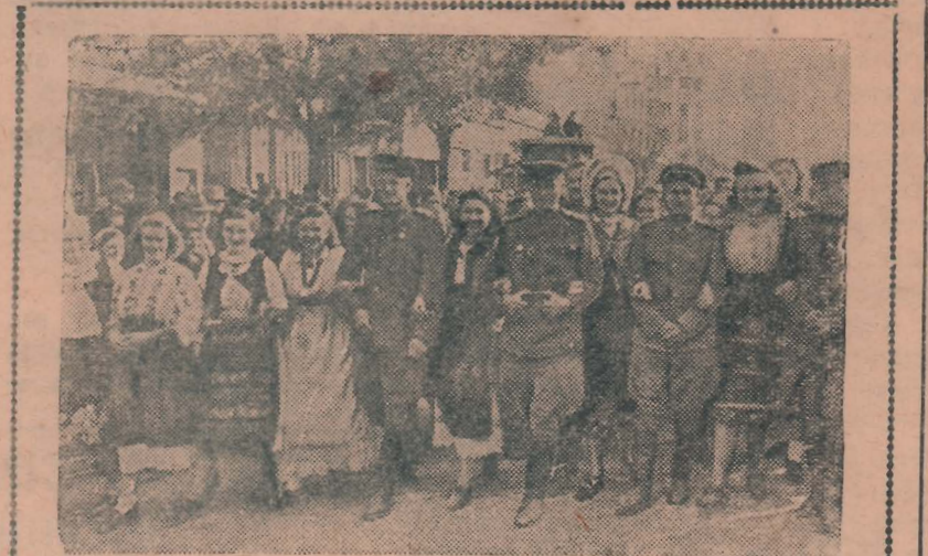
29 октября в столице Югославии Белграде состоялся парад югославских войск и партизан гвардии по случаю годовщины освобождения Белграда советскими и югославскими войсками от немецко-фашистских захватчиков. На сцене: жителя Македонии с советскими воинами на улицах Белграда.

«Я работаю прессовщицей, — пишет она. — Эту профессию я приобрела благодаря праву на труд, которое дала нам Сталинская Конституция. Нынче я буду голосовать в первый раз. Я изучаю Положение о выборах и с радостью