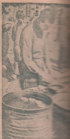
В Фулде (Германия) ар. Харбина). На снимке: конструктор завода на китайской территории фото С. Савенко.

Опыт партийной организации шахты «Журилка» нужно подхватить всем агитпунктам и также организовать выпуск стенных газет.