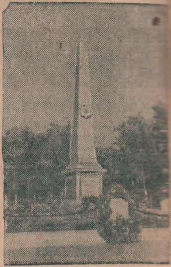
По инициативе жителей поселка Социальная Балка близ города Измаиль построена обелиск-памятник героям, погибшим в боях за свободу и независимость нашей Родины.