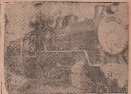
Первый послевоенный перевоз «Серг» Оражонкидзе (серия «СО»), запущенный Ворошиловградским паровозостроительным заводом имени Октябрьской Революции.

Президиум первого съезда польской рабочей партии.