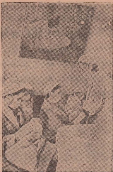
На Кировских островах в Ленинграде открылся санаторий матери и ребенка.

34-я сессия выработала план мероприятий по улучшению жилищно-коммунального и культурно-бытового обслуживания трудящихся в текущем году, в выполнении которого должны принять активное участие все трудящиеся нашего города. Депутаты горисполкома должны провести большую массовую работу с уличными комитетами, привлечь к благоустройству все городское население.