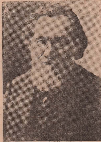
На днях советская страна отмечала 100-летие со дня рождения великого русского зоолога микробиолога И. И. Мечникова, одного из основателей современной экспериментальной медицины.

Исполнительный комитет Московского областного совета депутатов трудящихся решил организовать в районах Подмосквы на время полевых работ более 2200 колхозных детских яслей и площадок.