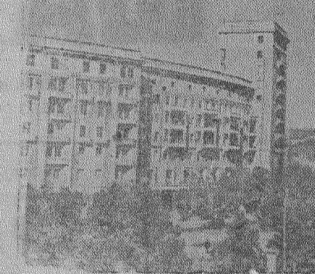
Театры, кино, наука, культура — все для трудящихся. На фото — Государственный