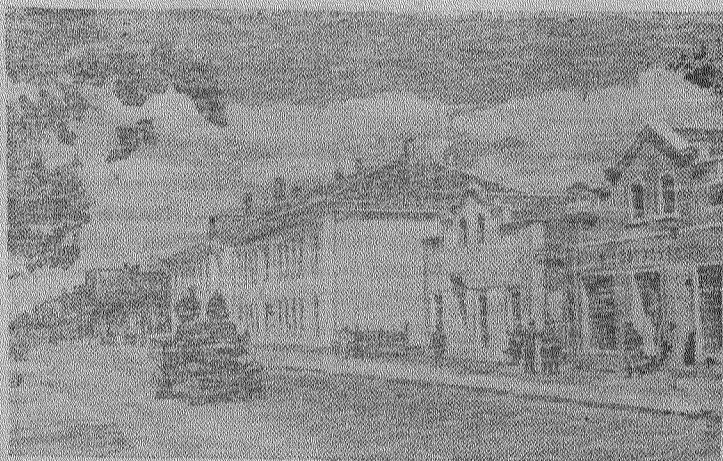
Белоруссия. Гор. Барановичи. Восстановленные дома по Советской улице.