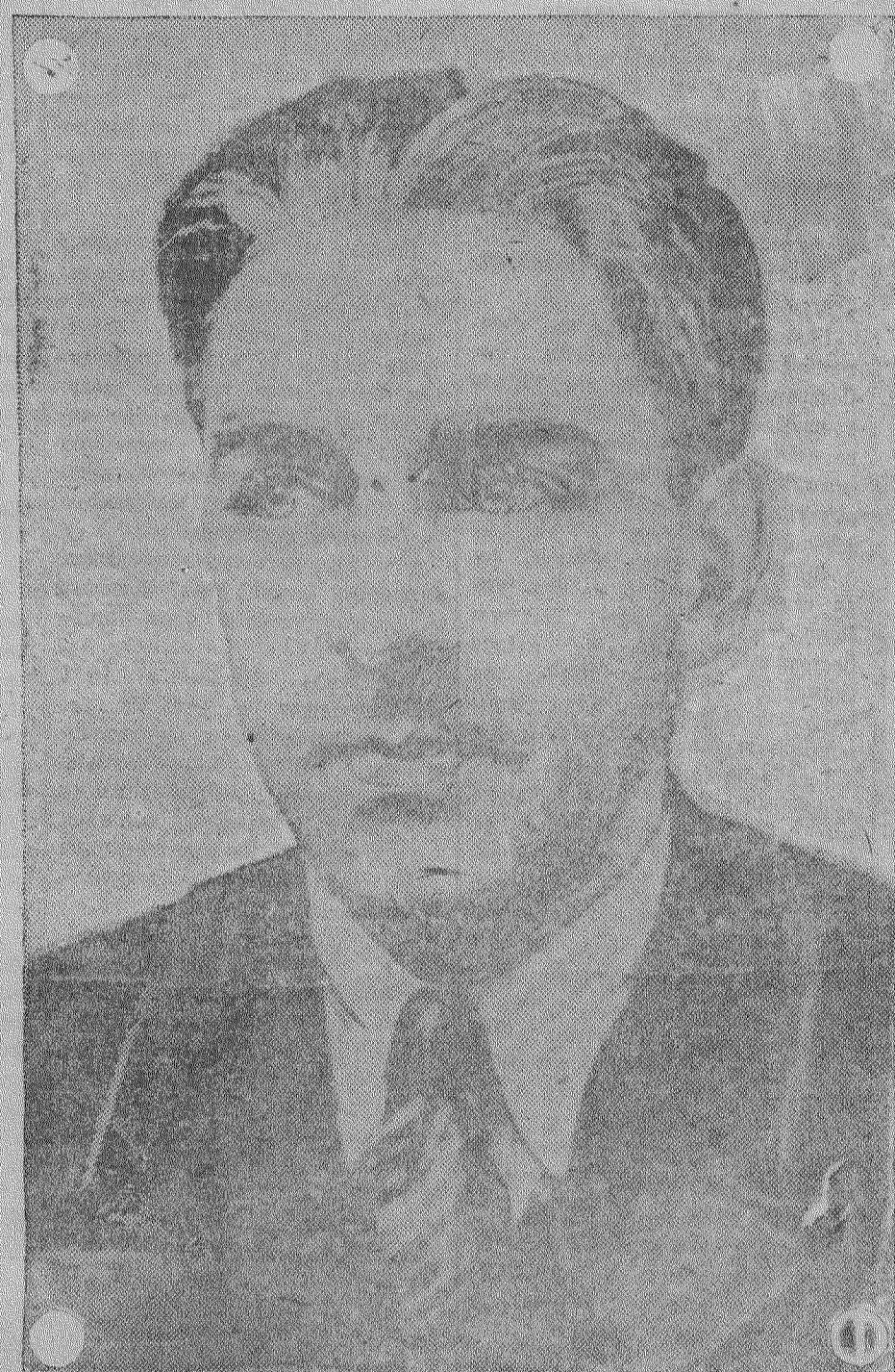
Иван Александрович Бенедиктов.

В день выборов—10 февраля 1946 года—единодушно голосуйте за верного сына русского народа, кандидата блока коммунистов и беспартийных, заместителя Наркома земледелия СССР—ИВАНА АЛЕКСАНДРОВИЧА БЕНЕДИКТОВА.