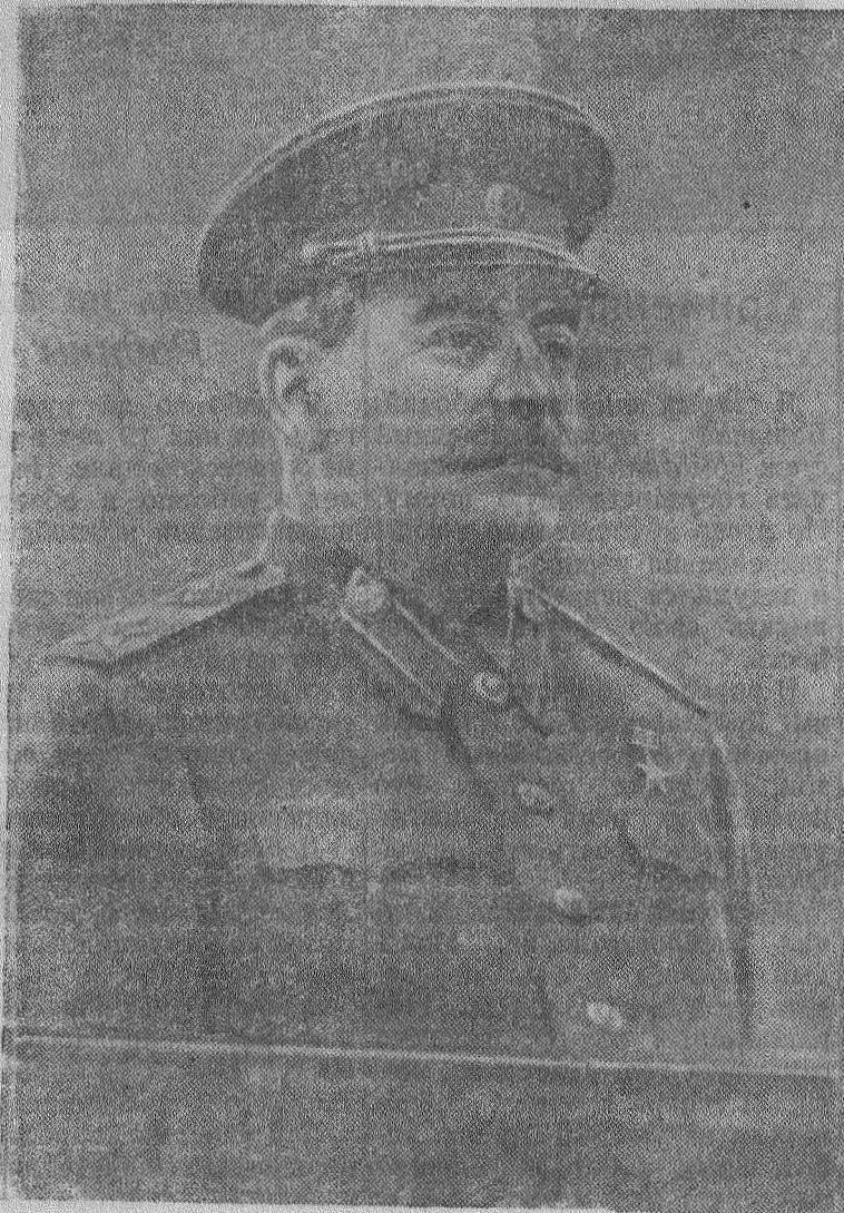
Председатель Совета Министров и Министр Вооруженных Сил Союза ССР Генералиссимус Советского Союза И. В. СТАЛИН.

Под знаменем Ленина, под водительством Сталина—вперед к новому расцвету советской Родины, к полной победе коммунизма в нашей стране!