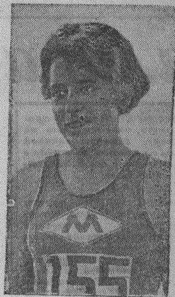
Всесоюзные легкоатлетические соревнования в Днепропетровске.

Горком ВКП(б), горисполком, горком союза угольщиков