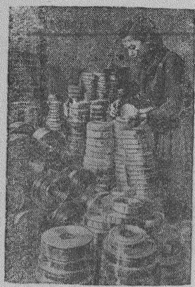
Завод „Красный Выборжец“ выпускает для тракторных заводов страны большое количество проката из цветных металлов.