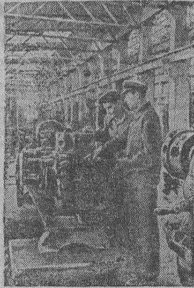
По Советскому Союзу