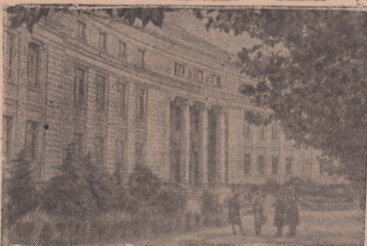
По городам Советского Союза Грузинская ССР. Тбилиси. Здание Государственного университета.

Широкий размах приобретет работа детских туристских лагерей. Организуются детские отряды для туристских походов.