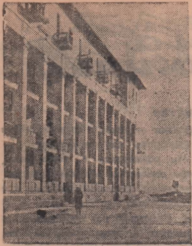
По городам Советского Союза Казахская ССР. Жилой дом рабочих Балхашского медеплавильного завода в городе Балхаш.