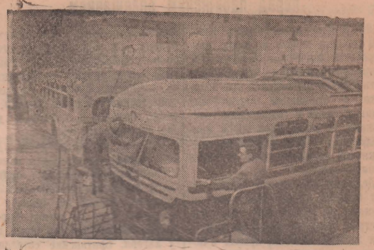
ЛЕНИНГРАД. Завод, где директором тов. Федин, приступил к выпуску цельнометаллических троллейбусов. На снимке: в цехе сборки цельнометаллических троллейбусов.

Г. ШАЛКОВ, шофер автобазы треста «Ленинголь».