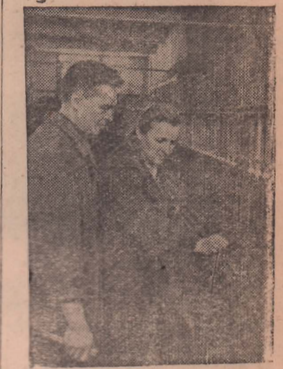
Московская область, На Павлово-Покровской прядильно-ткацкой фабрике в первом полугодии 1947 года установлено 38 ватерных машин.