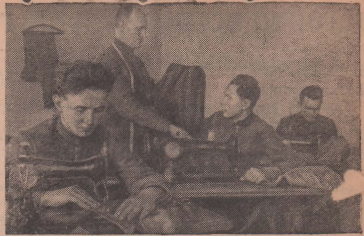
Швейная мастерская колхоза имени В. В. Куйбышева в селе Яршевка, Винницкого района УССР обслуживает более 600 колхозников.