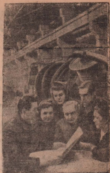
Набст речу выборов