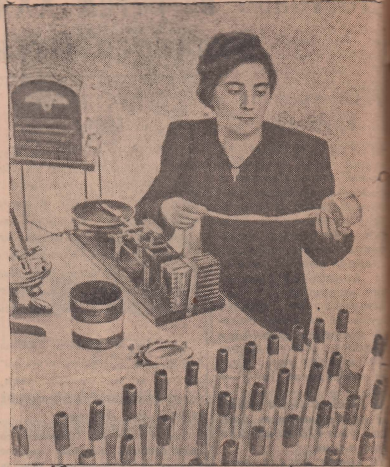
Москва. Всесоюзный научно-исследовательский институт стекланого волокна создан в первом году новой сталинской пятилетки. Институт работает над усовершенствованием процесса производства стекланого волокна и стекланых тканей. Здесь создаются сверхпрочные материалы на основе стекланых тканей в сочетании с пластическими массами.

Во французских демократических кругах растут опасения в связи с нынешним внешнеполитическим курсом французского правительства. Связав себя участием в порочной затее создания западного блока и восстановления германской военной мощи, оно рискует привести ей в жертву национальные интересы Франции. Горький исторический опыт — годы 1914 и 1939 — не должен, говорят в этих кругах, забываться.