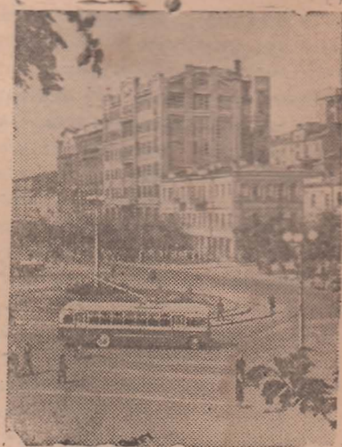
Киев. На площади имени Сталина

В 4-й сталинской пятилетке и в последующие годы в нашем городе, как одной из крупнейших баз угольной промышленности Кузбасса, намечено большое строительство новых шахт, ряда предприятий и других отраслей промышленности.