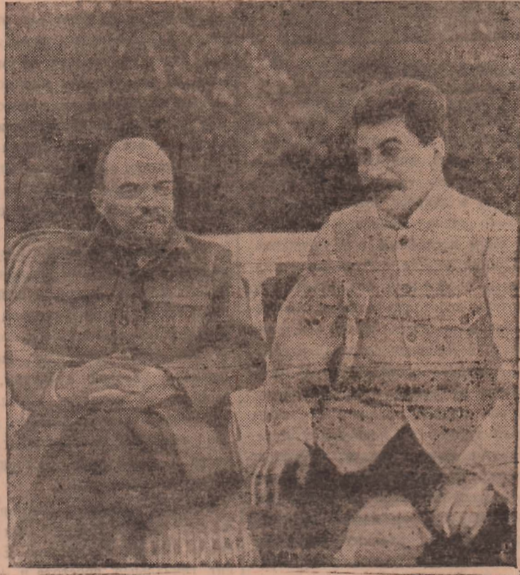
В. И. ЛЕНИН и И. В. СТАЛИН

Так было в годы Великой Отечественной войны, когда по призыву товарища Сталина страна напрягла все свои силы, чтобы разбить и уничтожить ненавистного врага