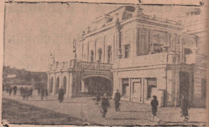
Омск. Здание областного драматического театра.

В состав особого соединения входило четыре подводных лодки, а также база подводных лодок «Нереус».