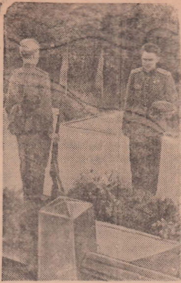
У могилы фельдмаршала Кутузова в городе Бунцау.

шийся в самолете советский генерал и два офицера интернированы. Указанное сообщение было подхвачено и констатировано агентством Рейтер. ТАСС уполномочен заявить, что это сообщение является вымыслом, распространяемым с явно провокационными целями.