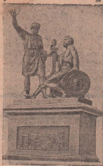
Памятник Минину и Пожарскому в Москве на Красной площади.

соревнование по выдаче сверхпланового угля в честь годовщины. Комсомольская организация шахты «А» взяла обязательство выдать 720 тонн сверхпланового угля во внеурочное время.