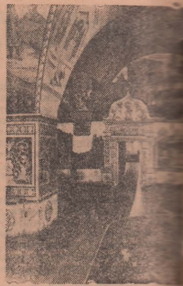
Москва. Большой Кремлевский дворец. Грановитая палата.

ПРАГА, (ТАСС). Ведомство внутренних дел в Братиславе передало для опубликования официальное сообщение, в котором говорится, что органы государственной безопасности уже продолжительное время наблюдали за деятельностью определенной антигосударственной организации, о которой было известно, что она печатает и распространяет антигосударственные листовки. 13 сентября этого года органами государственной безопасности в различных местах Словакии было арестовано 80 человек — членов указанной организации. При обысках у арестованных были найдены радиостанция, оружие, компрометирующие фотоматериалы, бланки с текстом антигосударственных прокламаций, множество антигосударственных листовок, нелегальные газеты и т. д. Предварительным следствием было выяснено, что эта организация готовила заговор против республики. Установлено также, что участники заговора были в прошлом членами запрещенной гитлеровской партии.