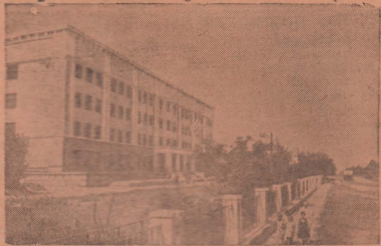
Сталинград. Восстановленная школа № 12 в Тракторозаводском районе.