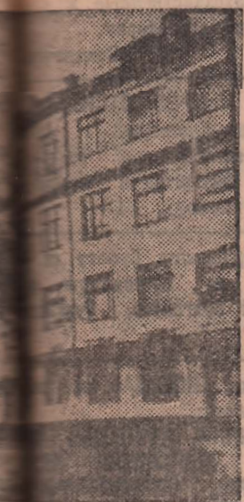
Ростовская область. Здание Новочеркасского Дома ученых после восстановления.

ческого рабства, могут легко осуществиться мечты молодежи. Пожелалось дальше учиться — иди учишься, перед тобой открыты двери всех учебных заведений. И вот мечту—приобрести специальность я решила осуществить на деле. Пройдя месячную практику на шахтах рудника, я поступила на второй курс горного техникума на плано-экономическое отделение. Снова я почувствовала себя ученицей, снова появилась знакомая тревога за успеваемость. Хотелось учиться не хуже других и оправдать доверие, повседневно оказываемое нам, будущим специалистам. Много пришлось поработать, чтобы узнать шахту. На стремление овладеть угольной специальностью и во что бы то ни стало освоить новое дело всегда побеждало. Я сдала по всем дисциплинам на «отлично».