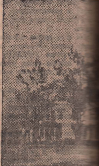
До революции в первых двухклассных школах обучалось свыше 20 семилетних детей, в которых обучаются тысячи детей. НА СНИМКЕ—одна из них.

Кругом водворилась тишина, и попрежнему все было неподвижно, утрало, безнадежно.