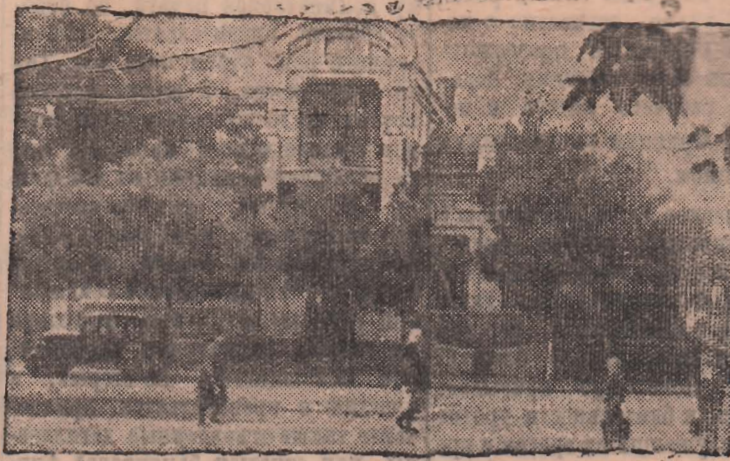
Ростовская область. Здание Новочеркасского Дома ученых после восстановления.

А. КРИВОНОВОГА, старший плановик шахты «Журилка».