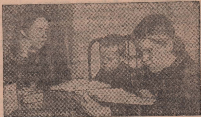
Культура прочно вошла в быт наших шахтеров. Посещение кинотеатра, Дворца культуры, лекций в клубах и красных уголках, чтение литературы, которой снабжают горняков библиотеки — все это стало жизненной потребностью для рабочих и их семей.