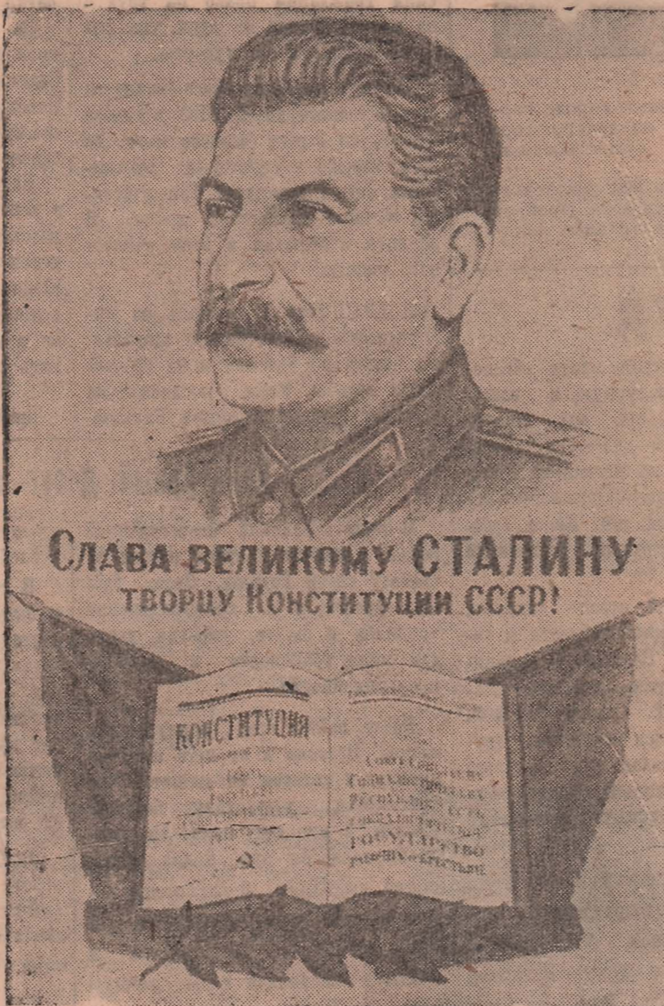
СЛАВА ВЕЛИКОМУ СТАЛИНУ ТВОРЦУ КОНСТИТУЦИИ СССР!

Да здравствует Сталинская Конституция! Да здравствует Сталину—теоретическому создателю Конституции СССР!