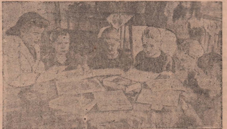
Большая сеть детских лечебных учреждений обслуживает детей шахтеров нашего города. Дети со слабым здоровьем отдыхают и поправляются в детских санаториях.