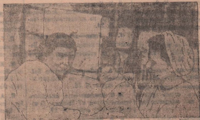
Широкая сеть лечебных учреждений для женщин-матерей открыта в нашем городе. Женские и детские консультации, молочные кухни, родильные дома охраняют здоровье матери и ребенка.