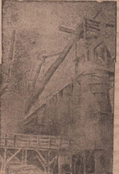
Тулская область. На Ново-Тулском металлургическом комбинате вступает в эксплуатацию первая в Советском Союзе доменная печь, которая будет работать на обогащенном кислородном дутье.