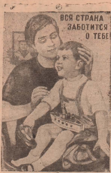
СВОЕЙ ЗАБОТОЙ СОВЕТСКИЙ НАРОД НЕ ОСТАВИТ СОЛДАТСКИХ СИРОТ. Плакат работы художника Н. Ватолыной.

течение ближайших трех лет (1947—1949 гг.). В тот же срок нужно не только восстановить, но и превзойти довоенное производство хлопка, льна-долгунца и сахарной свеклы. Посевные площади в 1947 году по сравнению с 1946 годом должны быть расширены на 10 миллионов гектаров, а урожайность зерновых культур поднята в среднем по всей территории Союза на 26 проц. К концу 1948 года будет восстановлен и превзойден довоенный уровень поголовья крупного рогатого скота, овец и коз. Для того, чтобы наше сельское хозяйство двигалось быстрыми шагами вперед, ему нужно дать больше тракторов, машин, удобрений, запасных частей к тракторам и машинам. В нынешнем году в сравнении с прошлым годом почти в 3 раза увеличивается выпуск тракторов, в 2,7 раза—выпуск сельскохозяйственных машин, в 5,2 раза—выпуск комбайнов. Увеличивается производство запасных частей к