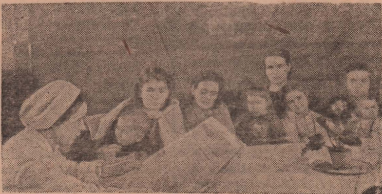
В комнате матери и ребенка Казанского вокзала (Москва) проводятся беседы с проезжающими матерями о предстоящих выборах в Верховный Совет РСФСР.