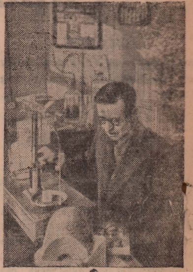
Лаборатория изоляционных материалов Всесоюзного научно-исследовательского института холодильной промышленности имени А. И. Микояна разработала технологию получения пеностекла—нового изоляционного материала.

Метражом мануфактуры, полученной шахтерами в первом квартале года, можно покрыть рас-