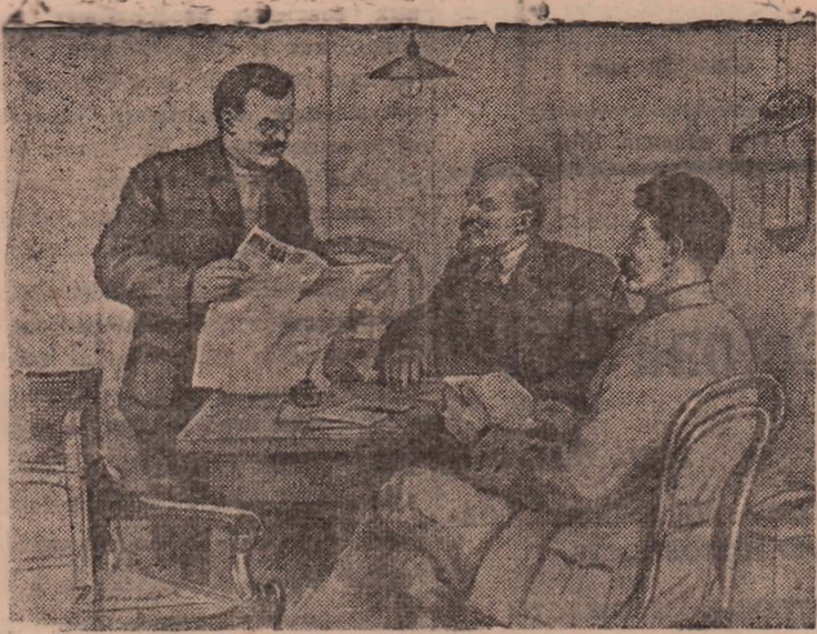
В. И. Ленин, И. В. Сталин и В. М. Молотов в редакции «Правды».

«Правда» стояла в центре борьбы за большевистскую партийность, сплачивая трудящихся вокруг партии Ленина—Сталина.