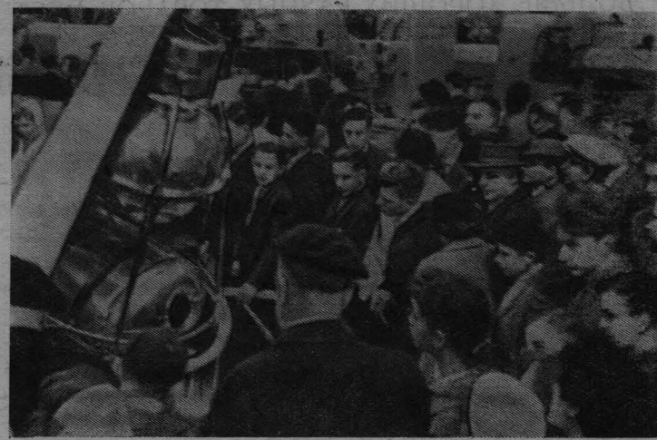
На Всемирной выставке в Брюсселе. У моделей советских искусственных спутников Земли в Советском павильоне после сообщения о запуске третьего спутника.

Обращаться по адресу: проспект имени Кирова, № 184-а в часы занятий.