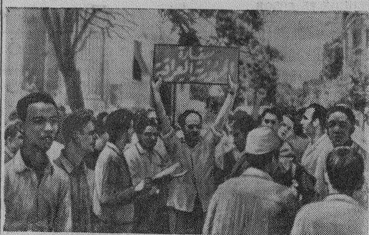
Перед посольством Иракской Республики в Каире (Объединенная Арабская Республика) иракские и иорданские студенты выражают свою радость по поводу провозглашения Иракской Республики. На транспаранте надпись: «Иракская Республика».