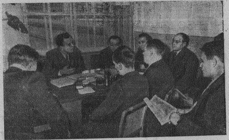
Тысячи работников Московского автозавода имени Лихачева приступили к занятиям в кружках, семинарах и политшколах сети партийного просвещения. Они изучают текущую политику, историю партии, философию, политэкономия, конкретную экономику промышленности, внешнюю политику.