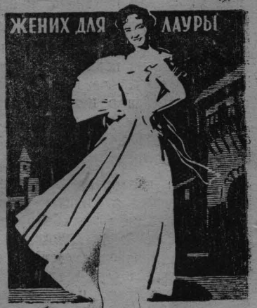
ЖЕНИХ ДЛЯ ЛАУРЫ Сеансы: 11-00, 12-50, 4-20, 6-15, 8-10, 10-00.

Адрес редакции: г. Ленинск-Кузнецкий, ул. Белинского, № 17, телефоны: редактора 0-33, секретаря 3-10, промышленного отдела — через трест, отдела культуры и писем трудящихся 0-52, директора типографии 2-21.