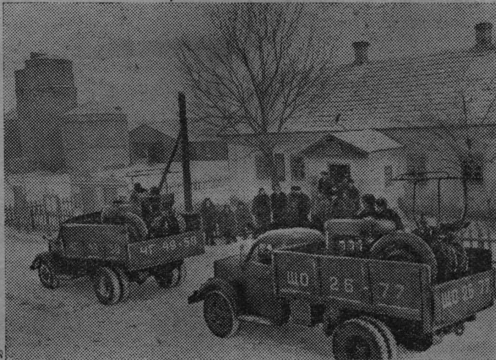
Днепропетровская область. За последние годы значительно выросли доходы колхозов области.

После заседания правления представители шахтеров выступили с концертом художественной самодеятельности.