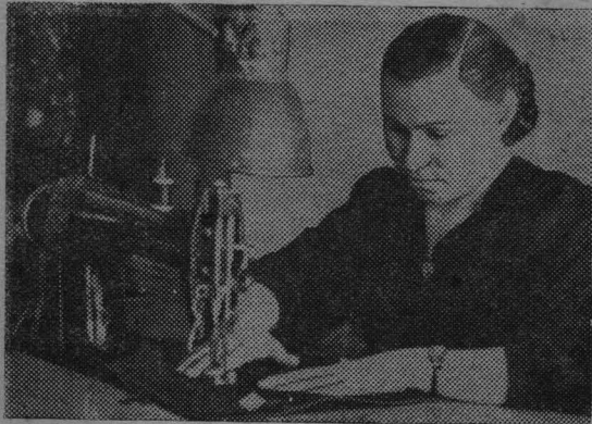
Коллектив швейной фабрики № 10 развернул соревнование за увеличение выпуска детской одежды, улучшение ее качества. Вместе с этим

Однако достаточно сойти с автобуса и пройти несколько кварталов, как вам бросится в глаза страшная запущенность. Перед окнами домов лежат кучи шлака и скопившегося за зиму мусора. Имеющиеся сборники нечистот очищаются редко. Поэтому доверху переполнены разными отходами.