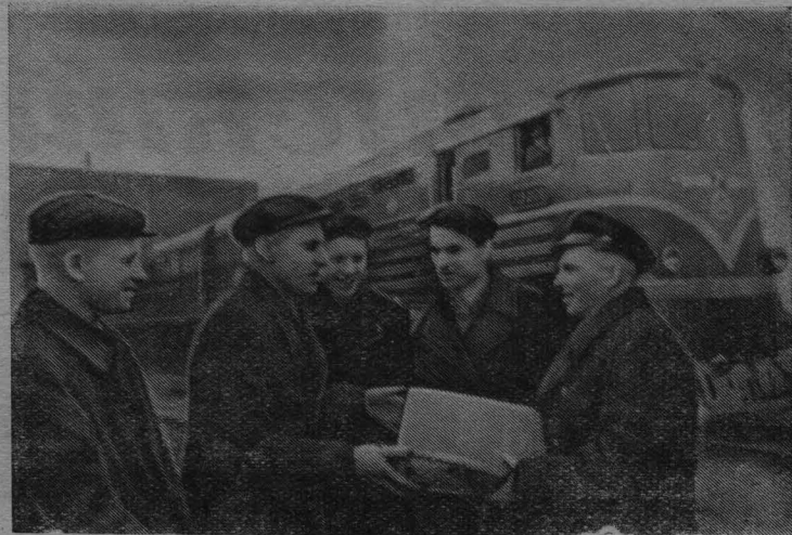
Луганск. Молодые производственники ордена Ленина тепловозостроительного завода имени Октябрьской революции, в короткий срок изготовили из экономлененного металла тепловоз мощностью 4 тысячи лошадиных сил в двух секциях. Молодые рабочие всех цехов предприятия принимали активное участие в его сооружении. Созданному руками комсомольцев и молодежи локомотиву присвоено имя «Комсомольский». В торжественной обстановке он был передан комсомольской локомотивной бригаде депо Ясиноватая Донецкой железной дороги.

Л. ГОЛОСОВ, секретарь парторганизации шахты «Полысаевская-2».