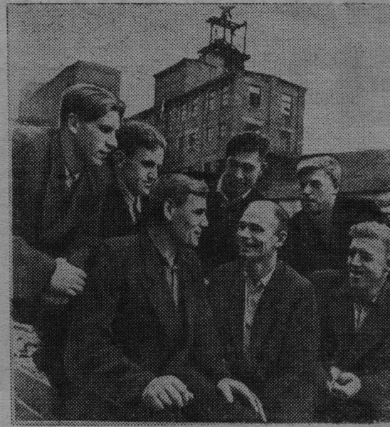
Кемеровская область. С хорошим почином выступили горняки шахты «Абашевская-2» треста «Куйбышев-уголь». Они разработали мероприятия по экономному расходованию крепежного леса

Большим злом, которое до сих пор не могут изжить на участках, является очковитательство. Вот конкретный факт. В своем выступлении на откры-